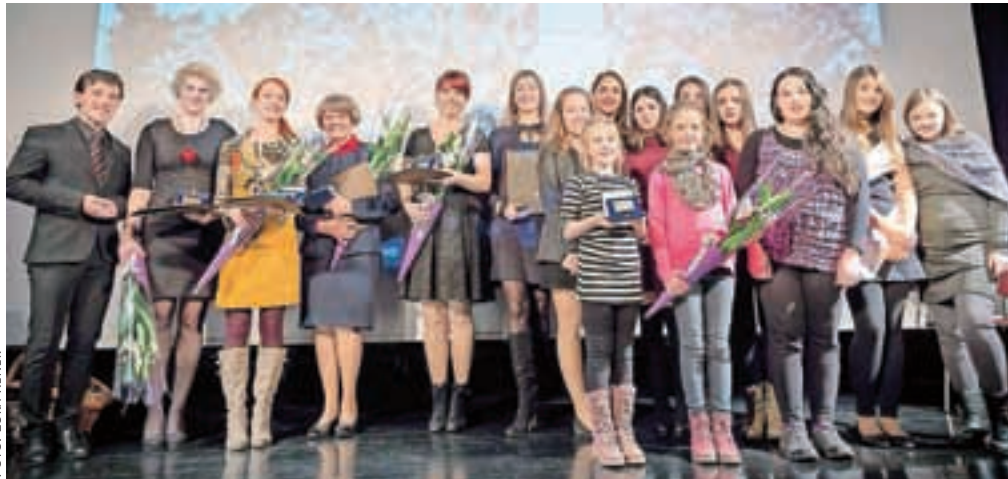
Tržičani, ki so dejavni na področju kulture, letošnji prejemniki Kurnikovih plaket

Bronasto Kurnikovo plaketo so prejeli na Ljudski univerzi Tržič, saj vrsto let dviguje zavest in pripadnost lokalni dediščini. Organizirajo različne dogodke, slikarsko šolo,