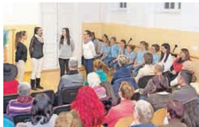
Raziskavo Pevska kultura Tržičanov so predstavili konec novembra na Balosu.

Z raziskavo smo pridobili kar nekaj gradiva za nadaljnje poustvarjanje pevške kulture Tržičanov, pridobljeno znanje pa želimo širiti in ga predati občanom, ki jim pesemska dediščina nekaj pomeni. Le tako se bo ohranila in živela med ljudmi.