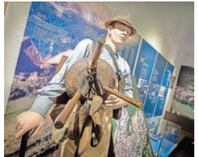
Le čevlje sodi naj kopitar; Ta veseli dan kulture v čast pesniku Prešernu